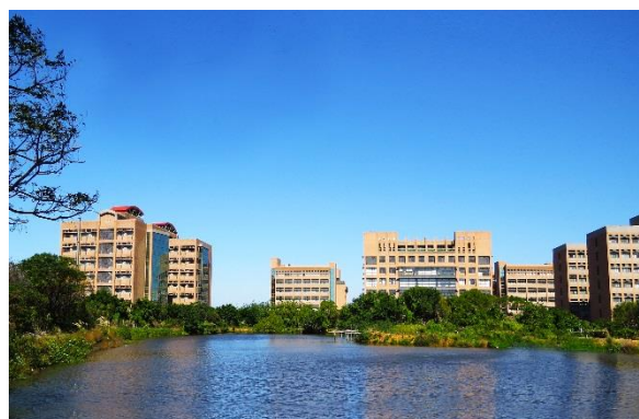
新竹校區 Hsinchu Campus