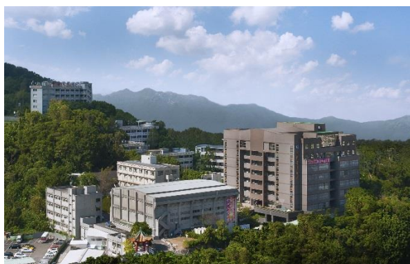
臺北校區 Taipei Campus